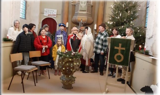
... in Martinskirchen