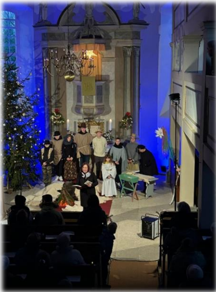
... in Fichtenberg