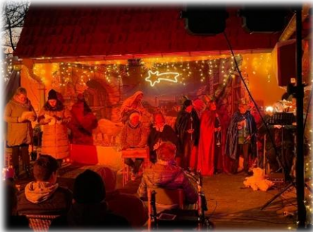
... in Koßdorf