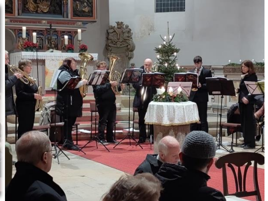
Weihnachtskonzert in Mühlberg