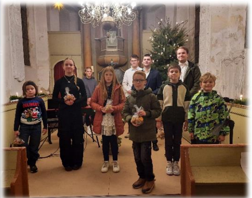
Adventskonzert in Martinskirchen