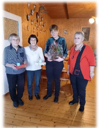
Senioren-Weihnachtsfeier in Langenrieth