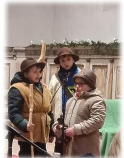
... in Mühlberg